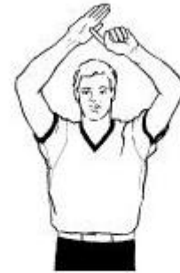
Former un "T" avec l'index et la main ouverte